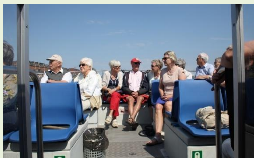
Det gode vejr nydes på sejlturen

Efterfølgende vandrede vi de få hundrede meter hen til restaurant "Under Uret", hvor vi nød en glimrende frokost.