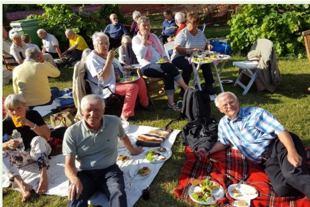
Hyggeligt samvær i Grønnegårdsteatret.

Sidst i august måned drog vi to dage med bus til Øst-Jylland, hvor vi den første dag besøgte Fængselsmuseet i Horsens og Moesgaard Museum med spændende rundvisninger begge steder.