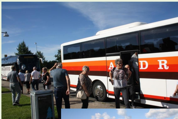
To dage i Østjylland

Den 21. juni mødtes vi 70 deltagere til det traditionelle besøg i Grønnegårdsteatret. Endnu engang var vi tilsmilet af vejrguderne, så vi i strålende solskin kunne nyde en lækker platte med tilhørende vin i et muntert og hyggeligt samvær, inden vi tog plads på tilskuerrækkerne og overværede årets forestilling, Jeppe på Bjerget, i en anderledes og spændende opsætning.