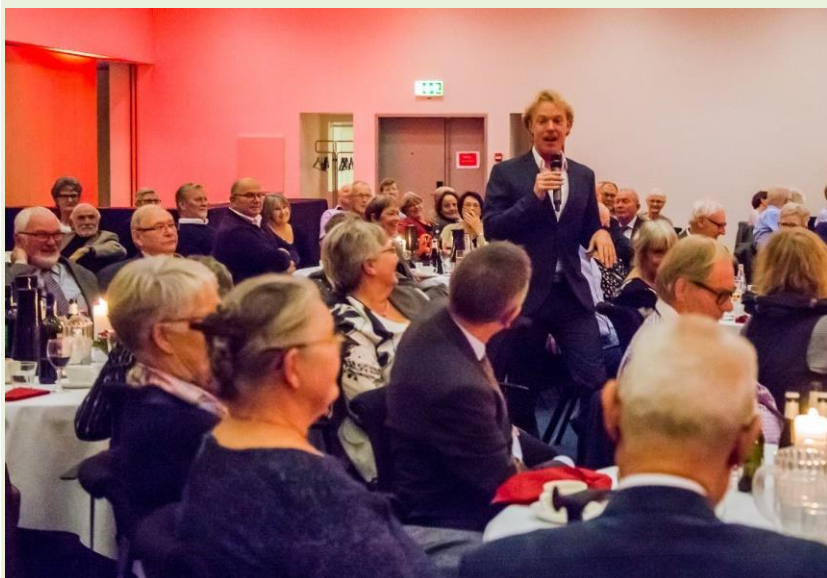
Munter underholdning til årets julefrokost

I begyndelsen af oktober var der stor tilslutning til et besøg på Politigården, hvor vi fik en meget spændende og morsom rundvisning i en fantastisk bygning med masser af arkitektoniske detaljer. Arrangementet afsluttedes med stegt flæsk på "Rio Bravo".