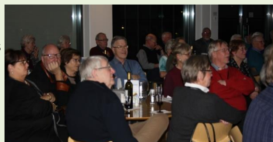
Der lyttes på generalforsamlingen