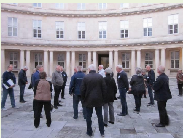
I den flotte runde gård på Politigården

I begyndelsen af oktober var der stor tilslutning til et besøg på Politigården, hvor vi fik en meget spændende og morsom rundvisning i en fantastisk bygning med masser af arkitektoniske detaljer. Arrangementet afsluttedes med stegt flæsk på "Rio Bravo".