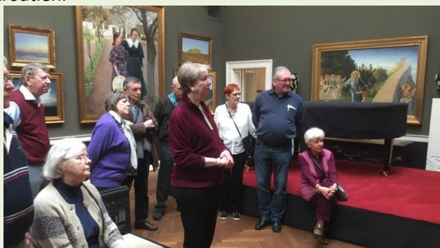
Rundvisning i Den Hirschsprungske Samling

I marts måned besøgte vi Den Hirschsprungske Samling i det lille hyggelige museum i Østre Anlæg.