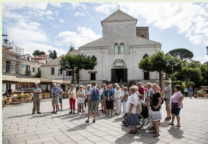
Amalfikysten. Besøg i Ravello

Så det blev otte dage med masser af oplevelser.