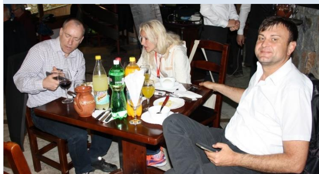
Rejseleder, guide og chauffør