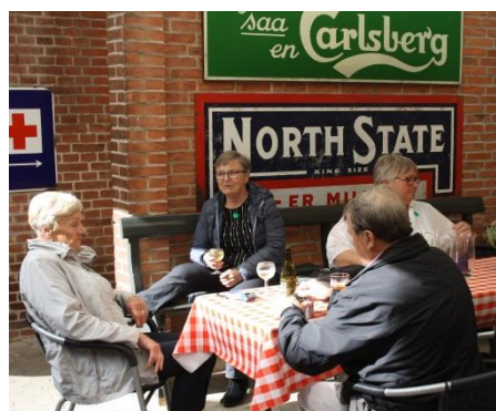
Der var også tid til lidt afslapning