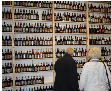
Og masser af øl