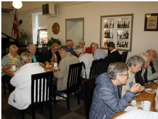
Kaffe med kage blev nydt i restauranten