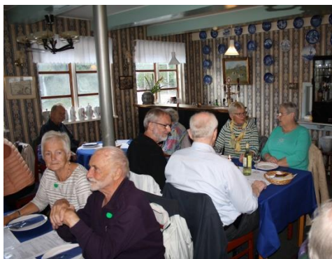
Sulten blev stillet – og alle blev mætte

Under vores ophold på Samlermuseet havde vejret været lidt blandet med regn og sol, men da vi forlod museet og kørte mod Nyord, var det blevet strålende solskin, så vi kunne nyde turen langs Ulvshale Strand, gennem den uberørte skov og videre over broen til Nyord, hvor vi snart nåede frem til Restauration Lollesegård og kunne indtage de ventende borde i det hyggelige restaurationslokale. Vi fik først serveret en kæmpe fiskefilet og kunne derefter nyde en lækker platte, mens snakken gik livligt.