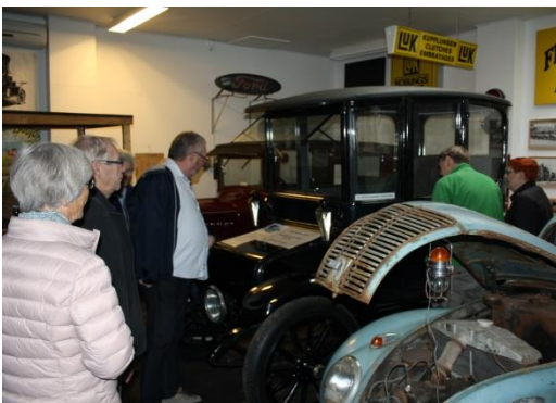
De gamle biler studeres. Her en el-bil fra 1916