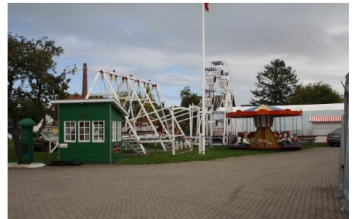
Flot tivoli og en lille benzinstation (BP)