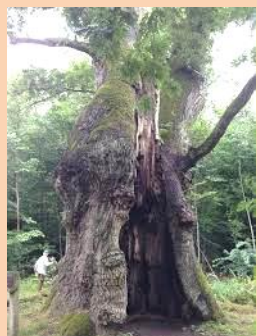
Den gamle eg