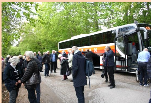
Klar ved bussen