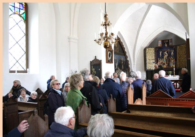
Inde i kirken

I en anden af de gamle avlsbygninger var indrettet restaurant. Her slog vi os ned klar til at nyde dagens frokost. Den var såmænd ganske udmærket, men aldrig har vi været ude for så langsom en servering. De unge damer, der stod for serveringen gen havde ikke megen forstand på, hvordan logistikken i en restaurant skal fungere. Det gjorde vi efterfølgende greven opmærksom på - han undskyldte med at overtjeneren var fraværende. Vi blev da mætte, men nåede desværre ikke at komme så meget ud i parken, som det var planlagt. De fleste nåede dog at se det imponerende 1000-årige egetræ, inden vi indledte busturen hjemad, som forløb uden trafikproblemer. Så vi nåede hurtigt tilbage til Ingerslevgade efter en afslappet tur i det svenske.