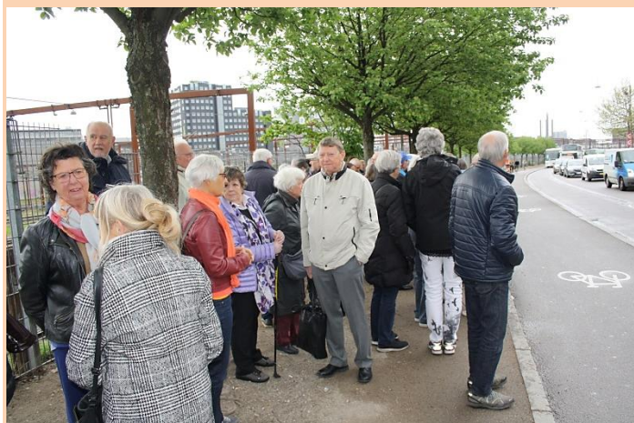
Der ventes på bussen

Onsdag den 8. maj steg dagens 54 deltagere på bussen i Ingerslevgade klar til kulturelle oplevelser i Skåne.