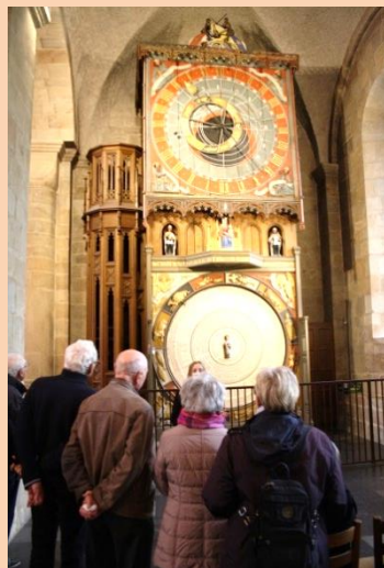
Det astronomiske ur

Uden trafikproblemer nåede vi over Øresundsbroen og kom hurtigt gennem paskontrollen, da man ikke ville se vores pas. I Lund kom vi lidt på en rundtur, da bussen var for høj til den direkte rute frem til domkirken, som var første stop på dagens tur.