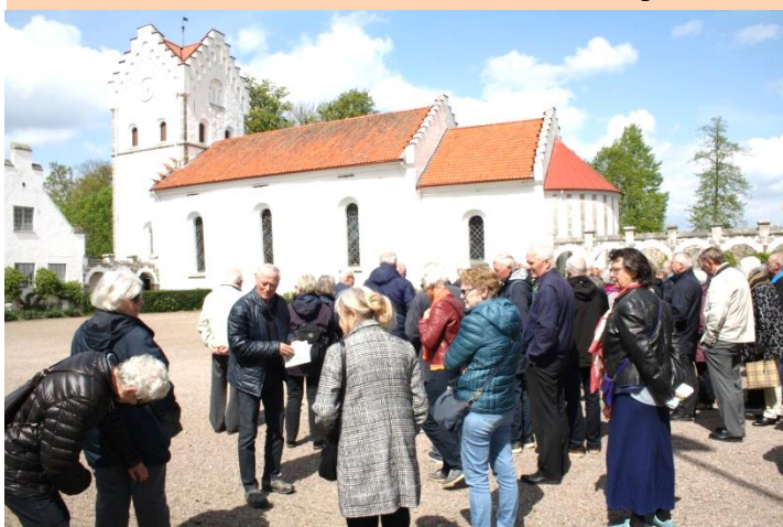
Bosjø Kloster i slotsgården ved kirken

Vi sluttede rundturen i en af de tidligere avlsbygninger, hvor der var en flot udstilling af naturfotos, "Fåglar & djur i nordisk natur".