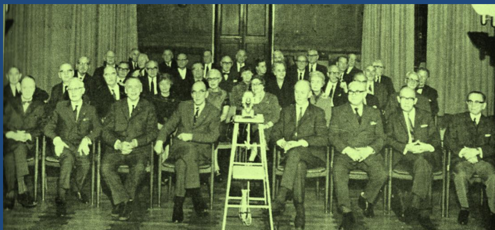
Stiftende generalforsamling i store mødesal på Sct. Annæ Plads

Foreningen fylder 50 år den 3. februar 2021