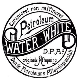
Indregistreret varemærke fra 1912.