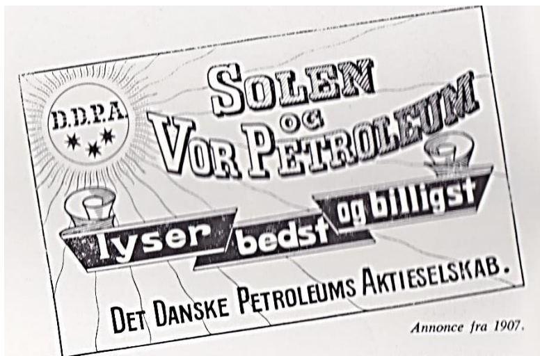
Annonce fra 1907.