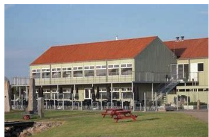
Hotel Rudkøbing Skudehavn