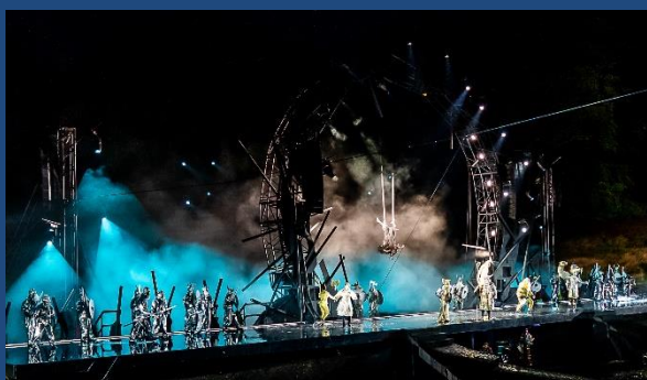
Spisning på Bakken og Ragnarok i Ulvedalene

Læs også om kommende arrangement: To dages bustur