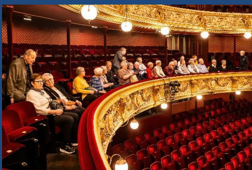
Rundvisning i Det Kongelige Teater

Vi har haft tre spændende arrangementer i løbet af foråret, som du kan læse om her i bladet: