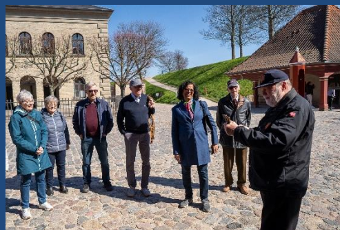
Rundvisninger i Designmuseum Danmark og på Kastelet