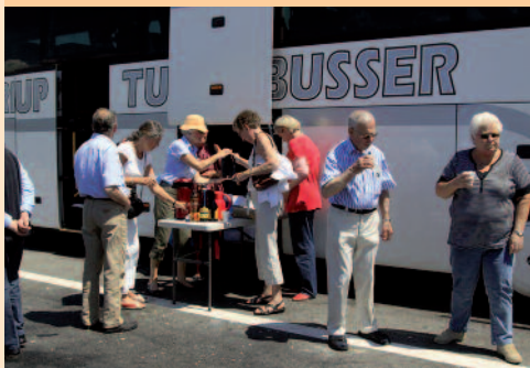
Da vi kom tilbage, var der lavet kaffe.