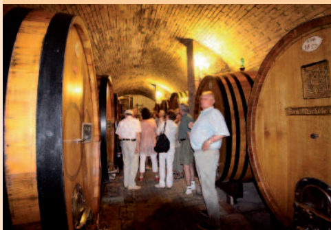
Rejseskribenten på besøg i vinkælderen.