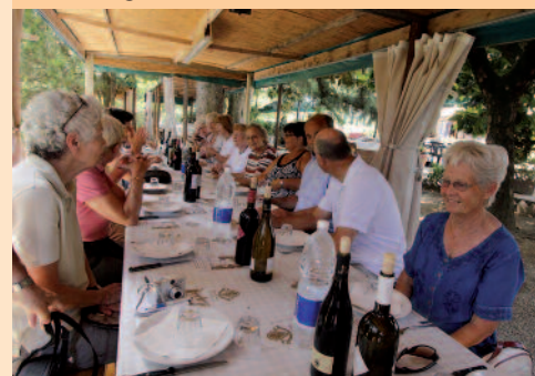
Vinsmagning og frokost i det fri.