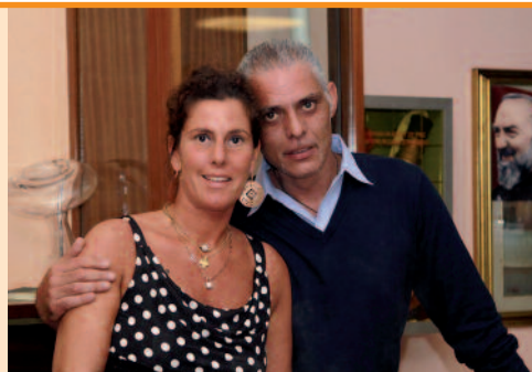
Værtsparet på Hotel Ambrosiano.

Før middagen mødtes vi i gårdhaven til den tradi-