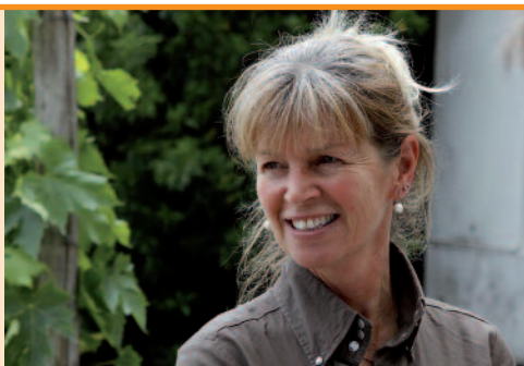
Vores guide til vinsmagningen.