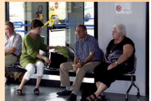
Vi venter på fly i lufthavnen i Parma.

Vi landede i Kastrup Lufthavn kl. 17:45. Den sidste times flyvning var rolig, men under turen havde der været en del turbulens, så enkelte deltagere havde spildt kaffe ned af sig. Nu kunne vi koncentrere os om at læse de seneste nyheder i aviserne, der cirkulerede fra sæde til sæde. Med Amagers flade landskab i syne følte man sig glad og lettet over at være hjemme i gamle Dannevang igen.