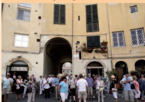
Piazza Anfiteatro i Lucca.