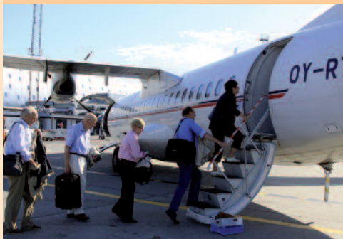
Vi går ombord i flyet.