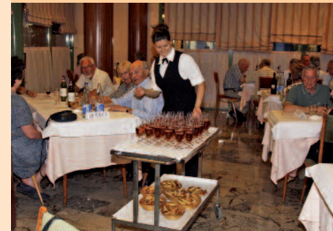
Aftenens dessert serveres på hotellet