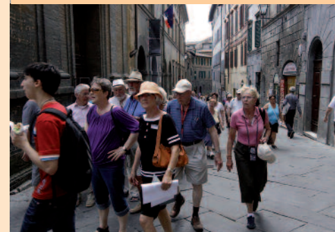
Vi vandrede i Gimignanos stræder og gader.