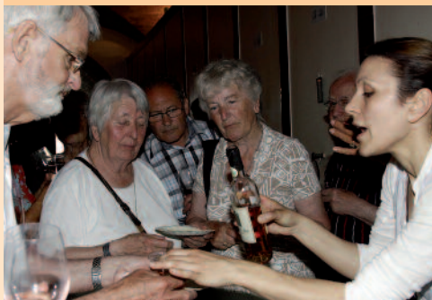
Vinsmagning er skam en alvorlig sag.