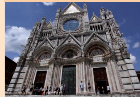
Sienas gotiske domkirke.

Den smukke domkirke er meget iøjefaldende med sin marmorbeklædning i sorte og hvide mønstre.