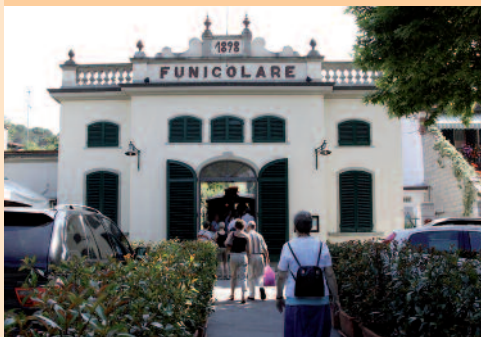
Finicolare – kabelbanens stationsbygning.