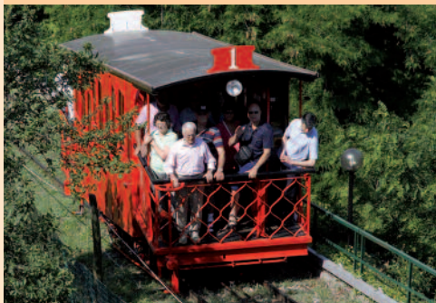
Kabelvogn på vej op til Montecatini Alto.

– som vi gjorde – med tovbane 'Funicolare', og som ikke er en svævebane, men en ganske speciel skinnebane med to vogne. Når den ene kører op, kører den anden ned. Der er kun ét spor, så midtvejs er der et vigespor, så alt foregår stille og roligt og sikkert. Turen tog 8 minutter. Højdeforskellen er 242 m og banen blev anlagt i 1898.