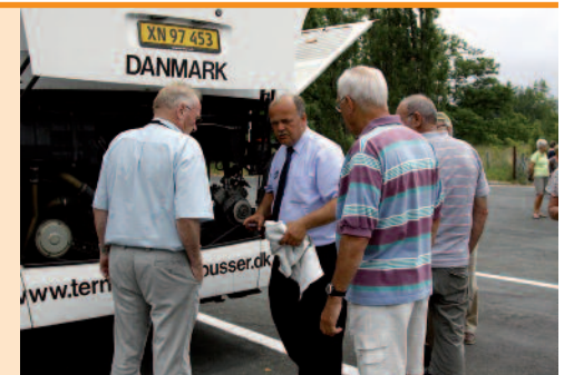
Aircon-anlægget efterses og justeres.

Efter spisningen gik steward og stewardesse gennem kabinen med drinksvognen. Vi kunne få kaffe, vand og the – intet andet. Ikke engang, hvis vi selv ville betale for det. Jeg kunne godt have tænkt mig at nyde en cognac til kaffen som en behagelig afslutning på ferien. Men sådan skulle det ikke være.