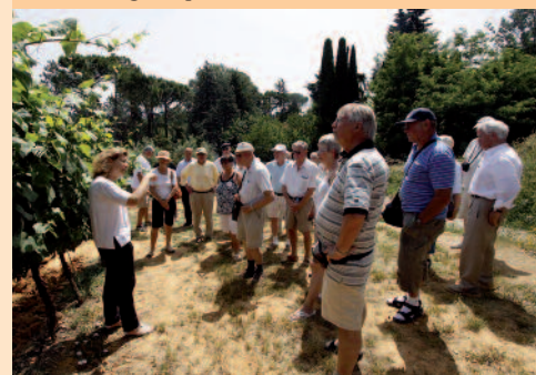
Rundvisning i vinmarken.