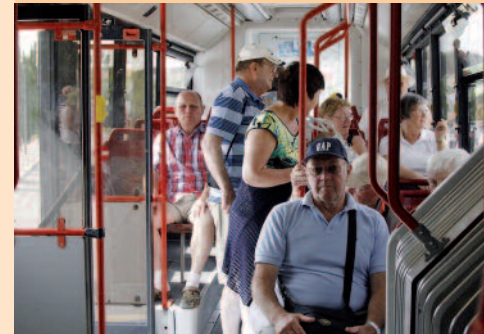
Vi tog med shuttle-bussen