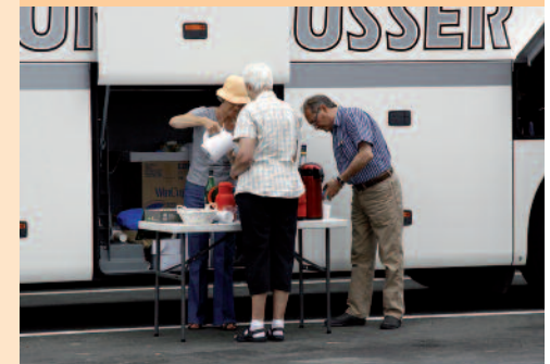
Der er kaffe ved bussen.