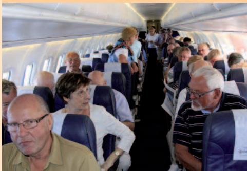
Deltagerne i flyets kabine.