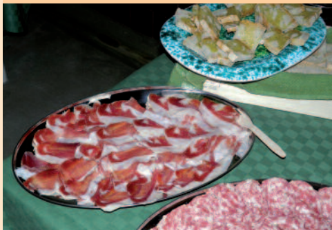
Pålæg ved frokosten under vinsmagningen.