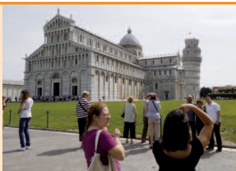
Domkirken, Dåbskapellet og Det Skæve Tårn i Pisa.

Bestyrelsen havde holdt et lille møde på torvet i Lucca og var blevet enige om, at de ikke ville komme hjem med overskud, så derfor var der en drink til alle før maden. Denne aften var der nemlig Candlelight Diner med dans bagefter til levende musik. Den indendørs swimmingpool var ble-