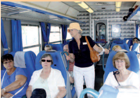
Ombord i toget på vej til Firenze.