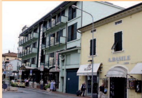
Farvel til hotellet i Montecatini.

hurtigt tømt cafeteriaet for alt spiseligt. Imens fik chauffør Torben kontakt med bussens serviceværksted og fik klaret problemerne med anlægget. Da vi fortsatte, virkede koldluftdyserne igen.