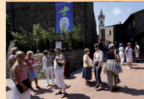
Et af museerne i Vinci.