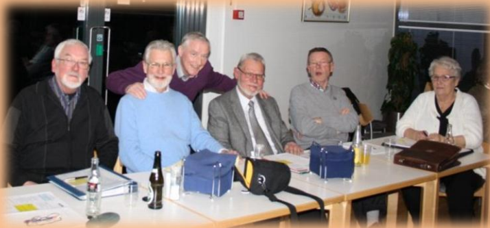
Bestyrelsen og dirigenten