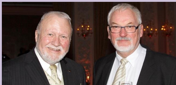
De to redaktører gennem de 15 år.

Her 15 år efter starten har vi fornøjelsen af at udgive SeniorNyt nr. 50.